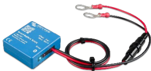
Bluetooth-Erkennung Smart Battery Sense