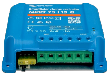
SmartSolar Lade-Regler MPPT 75/15