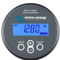
Bluetooth-Erkennung BMV-712 Smart Battery Monitor