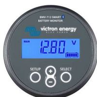
Bluetooth-Erkennung: BMV-712 Smart Battery Monitor