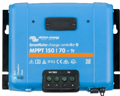
SmartSolar-Lade-Regler MPPT 150/70-Tr ohne optionales Display