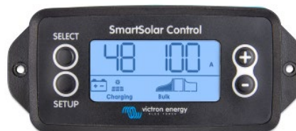
Einsteckbares SmartSolar display

Entfernen Sie einfach die Gummidichtung, die den Stecker an der Vorderseite des Reglers schützt und stecken Sie das Display ein.