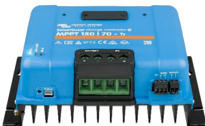
SmartSolar-Lade-Regler MPPT 150/70-Tr ohne Display